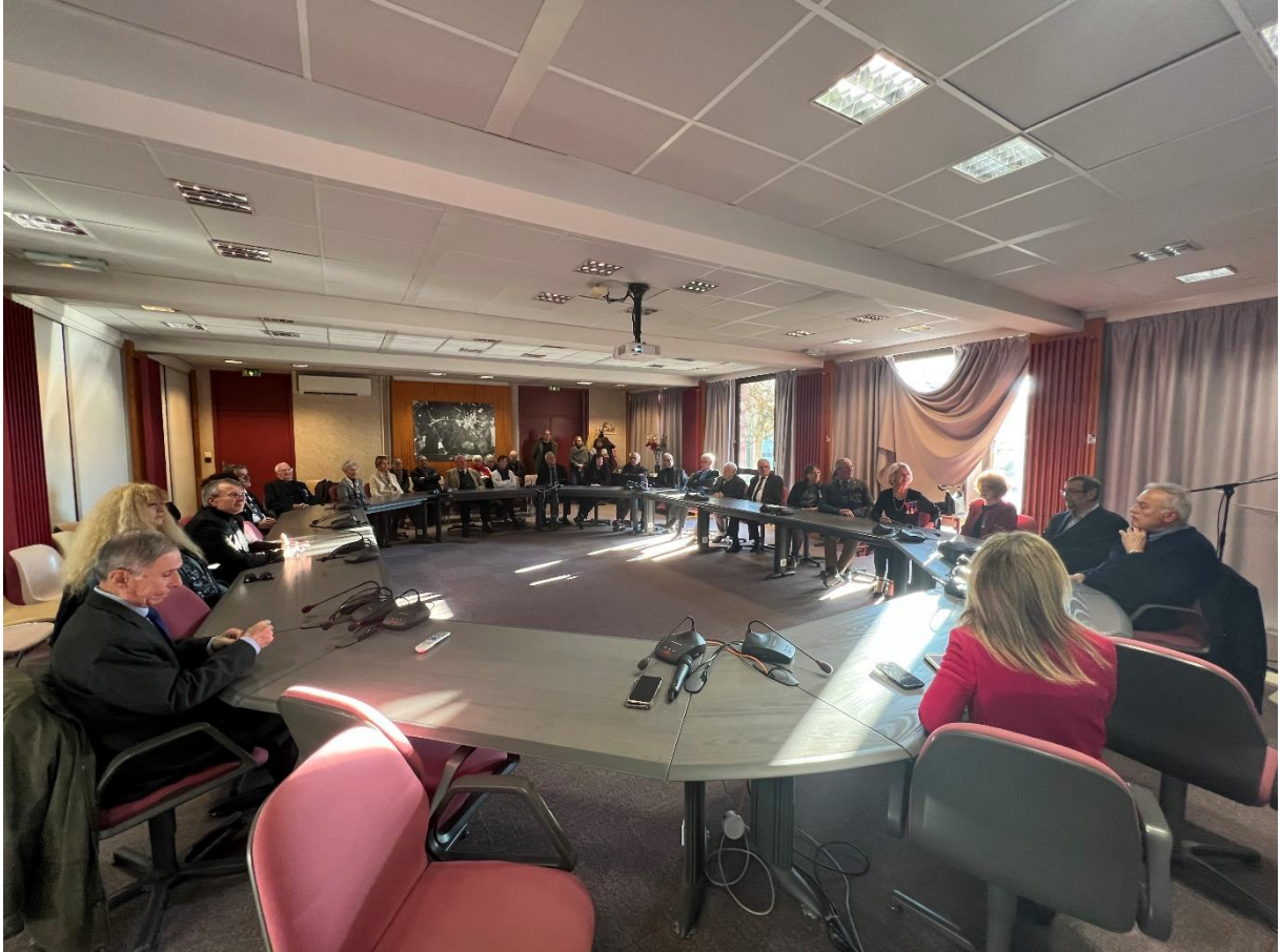
Figure 1 Salle du conseil municipal